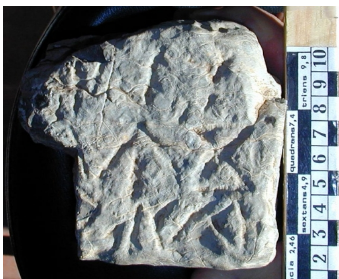
Créditos: Velaza 2008