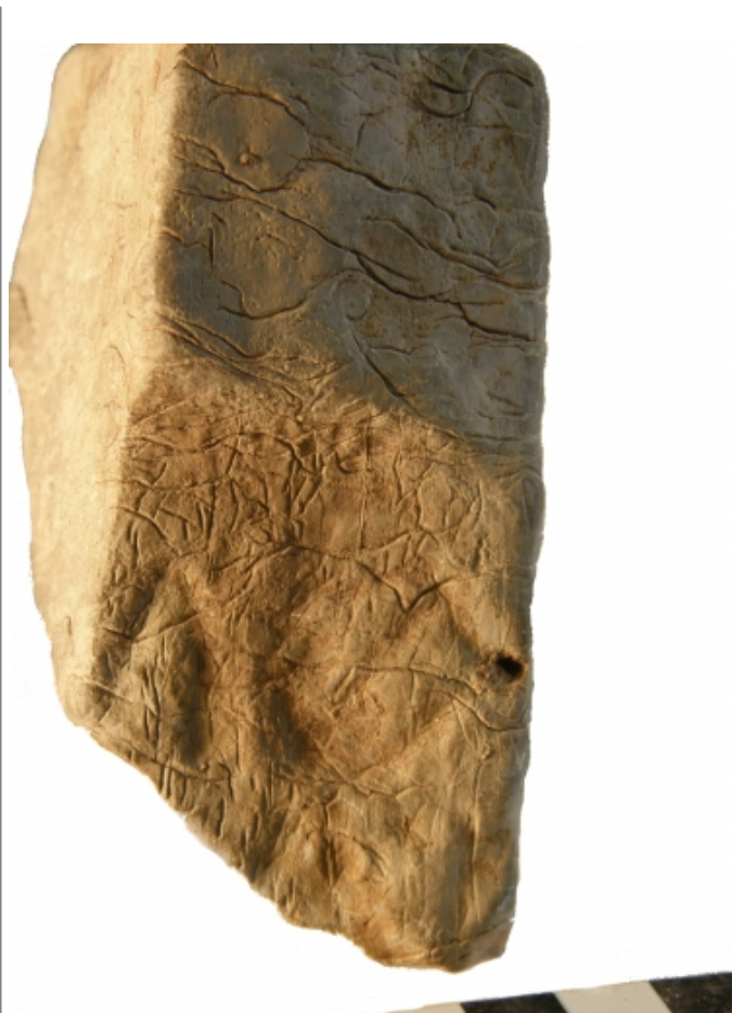
Créditos: Ignacio Simón Cornago