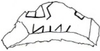
Créditos: Roca 1988