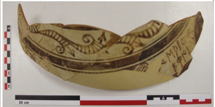
Créditos: Museu de Prehistòrica de València. Foto: ALF (sept2014)