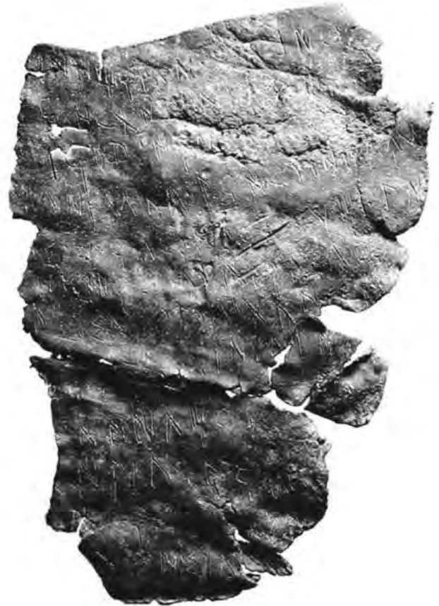
Créditos: R. Marichal (Rébé et al. 2012, 248)