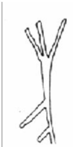
Créditos: Dibujo: Vicente et alii 1993, 767.