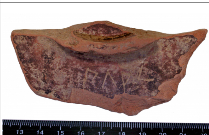
Créditos: A. G. Sinner