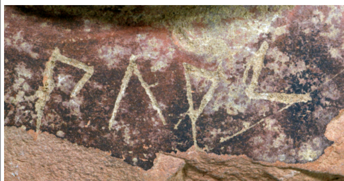
Créditos: A. G. Sinner