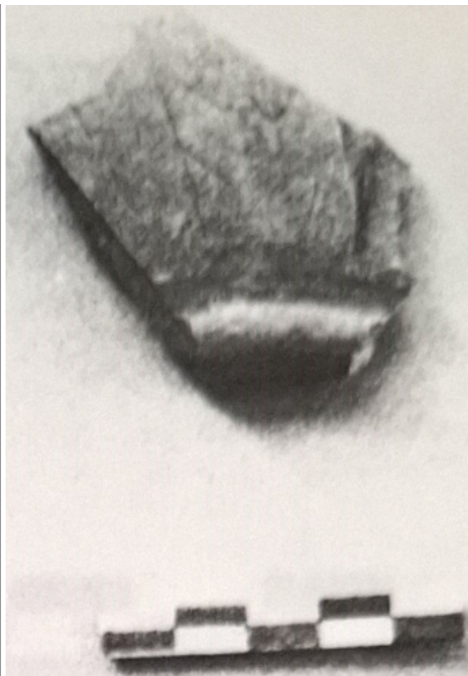
Créditos: N. Molist