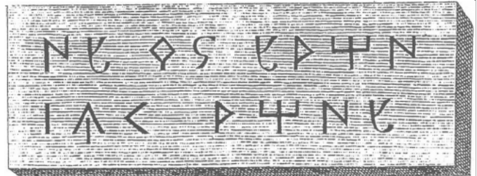
Créditos: Erro 1806