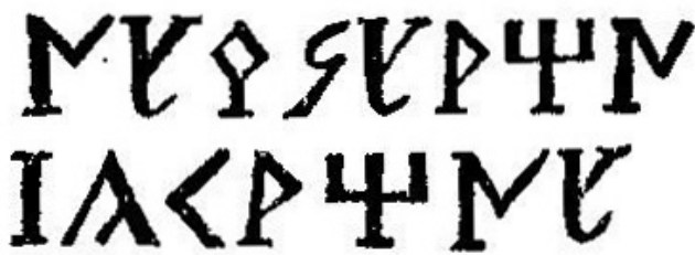
Créditos: Ximeno 1784