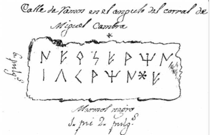
Créditos: Almagro-Gorbea 2003