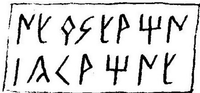
Créditos: Almagro-Gorbea 2003