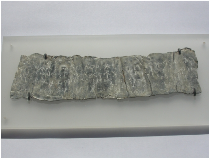
Créditos: J. Velaza