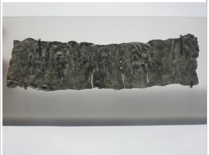
Créditos: J. Velaza