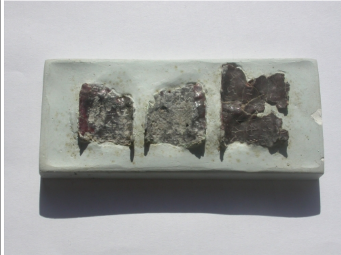
Créditos: J. Velaza