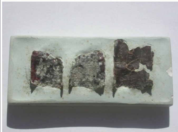
Créditos: J. Velaza