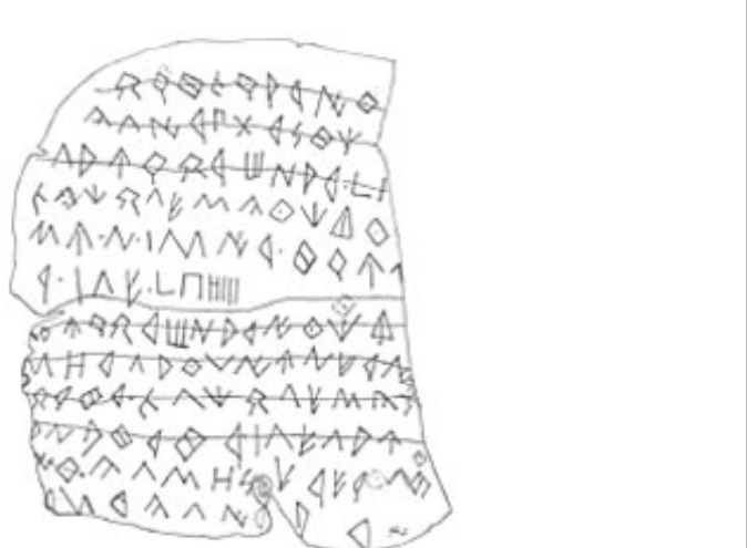
Créditos: Fletcher 1985