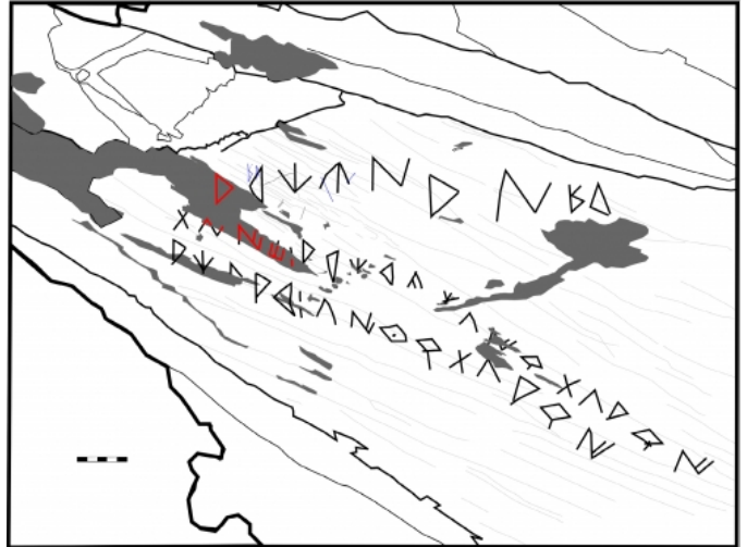
Créditos: PC-JFJ, Palaeohispanica 10