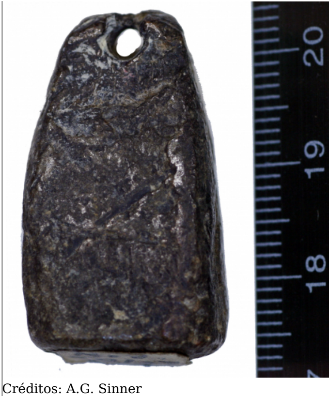
Créditos: A.G. Sinner