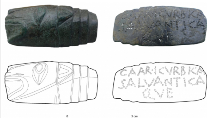
Créditos: Fotos: M. Á. Ríos Pérez. Dibujo: M a C. Sopena, apud Beltrán et alii 2020, 160.