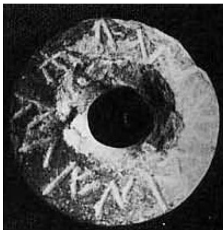
Créditos: David Stifter