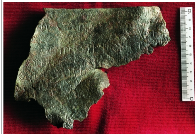
Créditos: F. Villar y C. Jordán