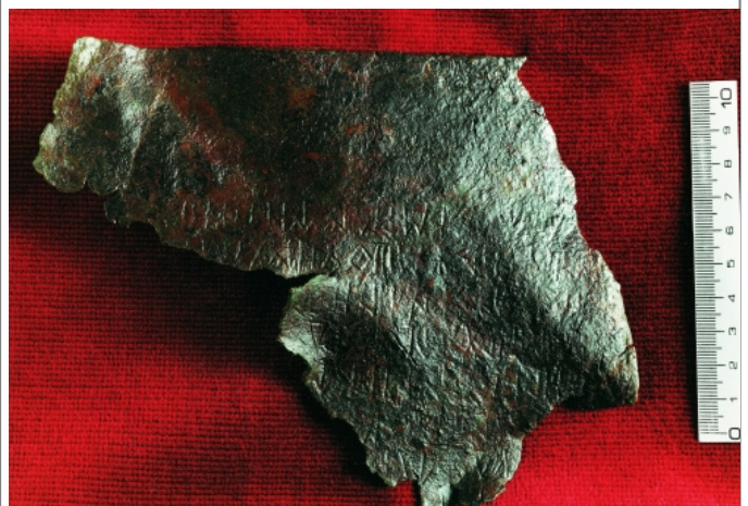
Créditos: F. Villar y C. Jordán