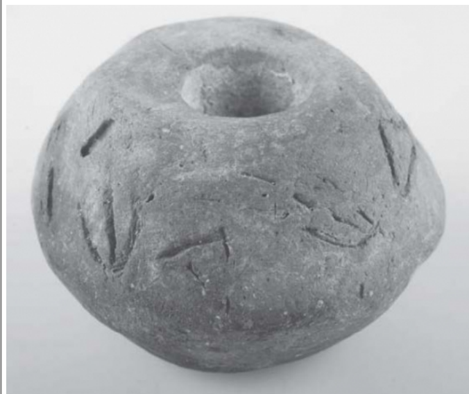
Créditos: Foto: De Bernardo et alii 2011, 415.