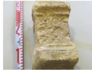
FIGURA 168a. Fotografía del petit altar MNAT 338 amb el text ibèric A (núm. 48,A).