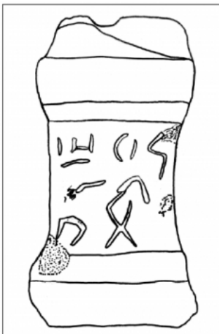
FIGURA 167a. Dibuix del petit altar MNAT 338 amb el calc del text ibèric A (núm. 48,A).