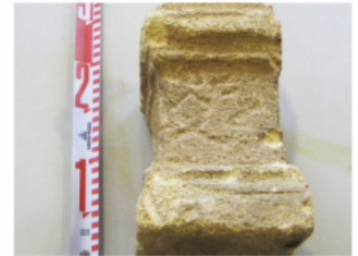
FIGURA 168b. Fotografía del petit altar MNAT 338 amb el text ibèric B (núm. 48,B).