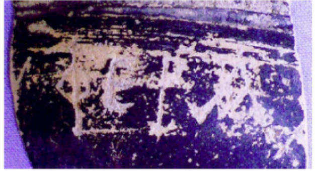
FIGURA 39. Fotografia de la inscripció ibèrica de la Llosa (núm. 9).