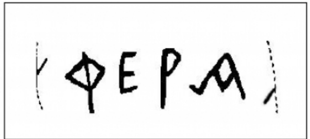
FIGURA 40. Calc de la inscripció de la Llosa (núm. 9).