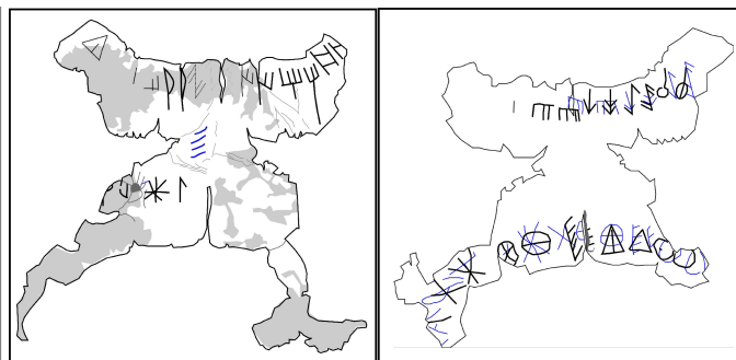
Créditos: Ferrer i Jané 2014