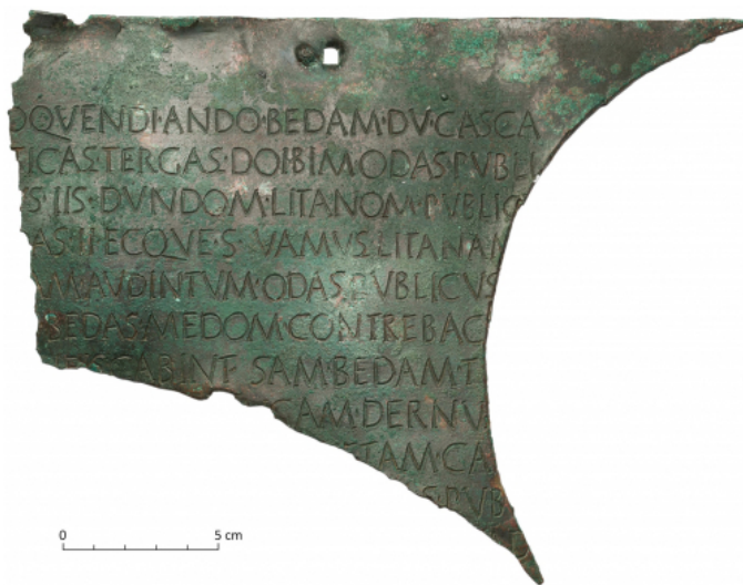
Créditos: Foto: J. Garrido, Museo de Zaragoza, apud Beltrán et alii 2020, 48.