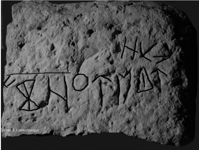
Créditos: J. Gorrochategui