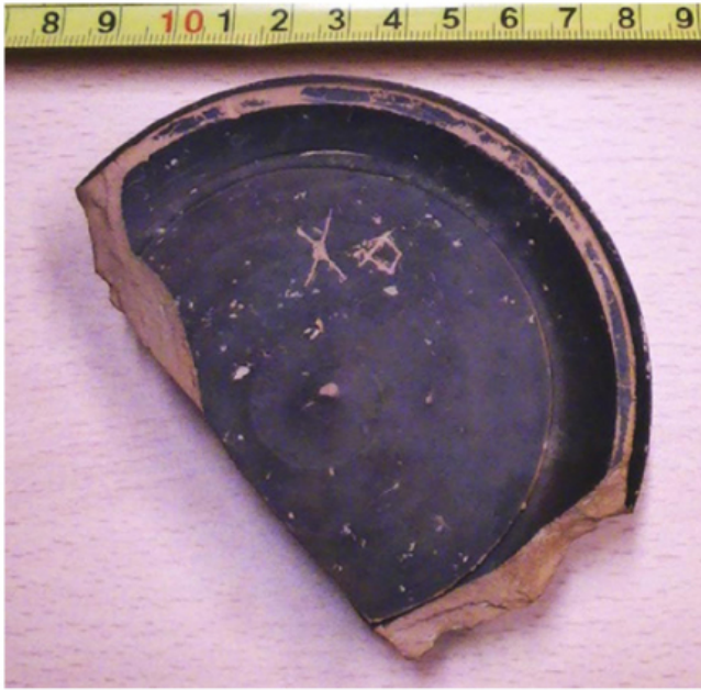
FIGURA 65. Fotografia de la base del fragment de pítide amb la ubicació de la inscripció núm. 16.