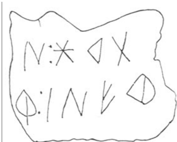
Créditos: Silgo - Fletcher 1987