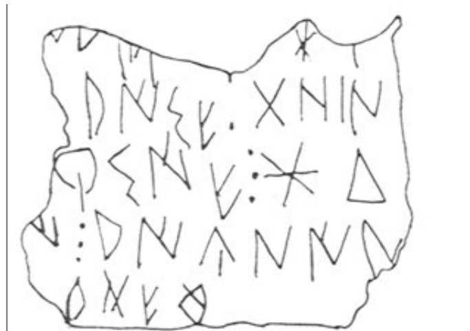
Créditos: Silgo - Fletcher 1987