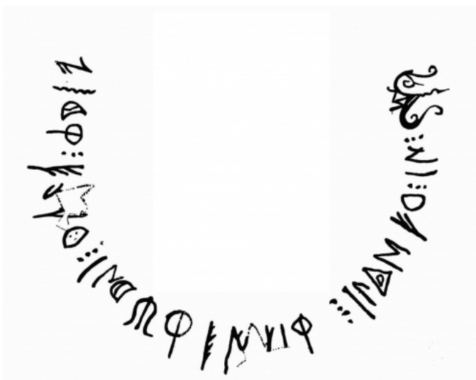
Créditos: Fletcher 1985, fig. 16