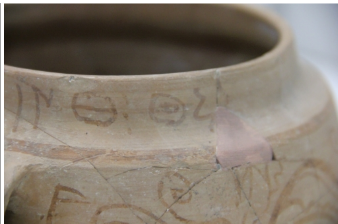
Créditos: Museu de Prehistòria de València. Foto: ALF (junio2014)