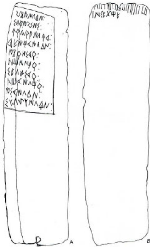
Créditos: Fletcher 1984a