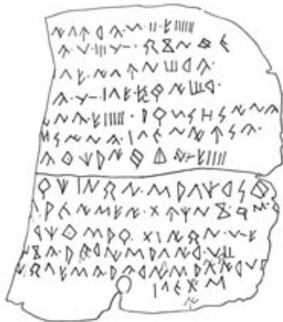
Créditos: Fletcher 1985