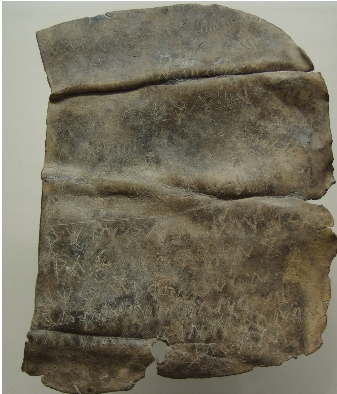
Créditos: Foto: Museu de Prehistòria de València_Depósito: Museu de Prehistòria de València