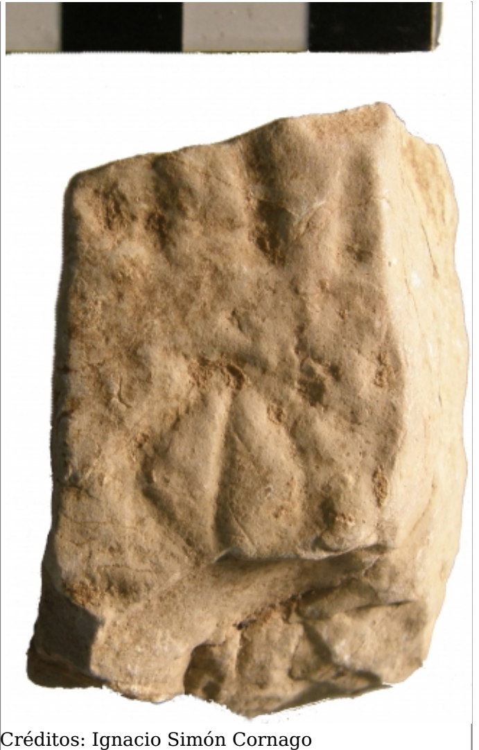
Créditos: Ignacio Simón Cornago