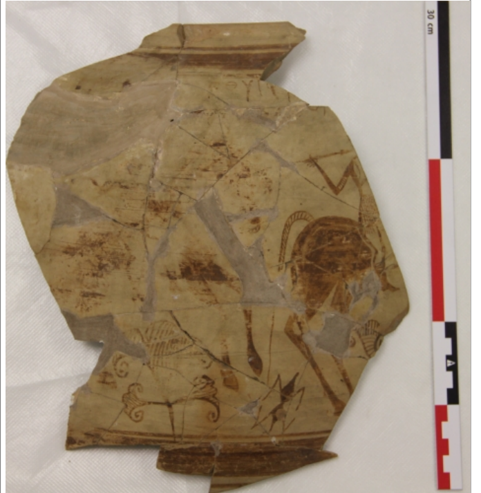
Créditos: Museu de Prehistòria de València_Foto: ALF_junio2014