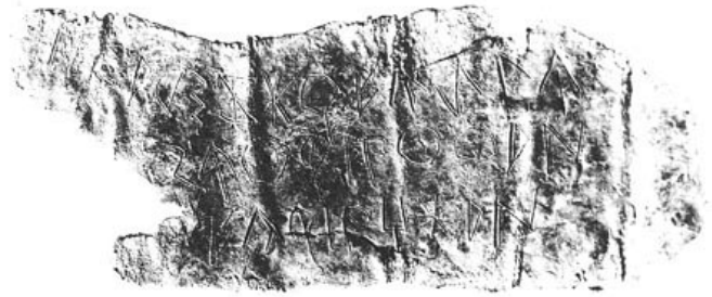
Créditos: Guérin - Silgo 1996