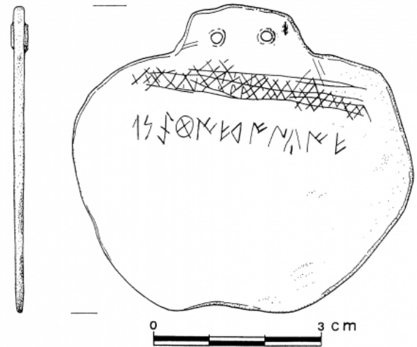
Fig. 73: Plomo ibérico de El Cerro de las Balsas. Sección y reverso (calco según J. Elayi)

Créditos: qnt2-cerro de las balsas-reverso_2006_lam. XV (foto de S.I.P.)