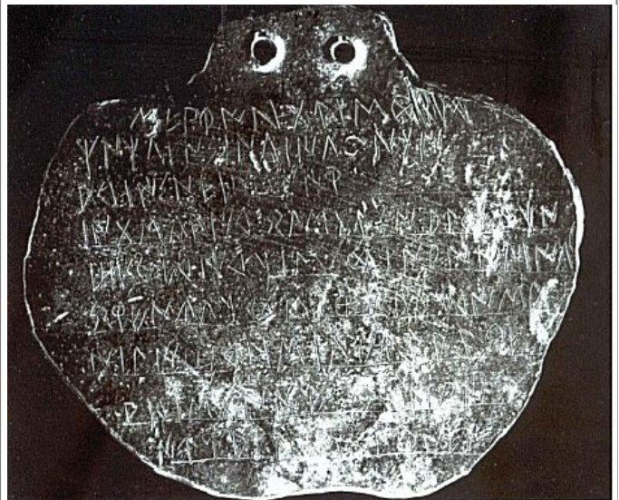
Créditos: lqnt-2_el cerro de las balsas-anverso_2006, lam. XIV (foto del S.I.P.)