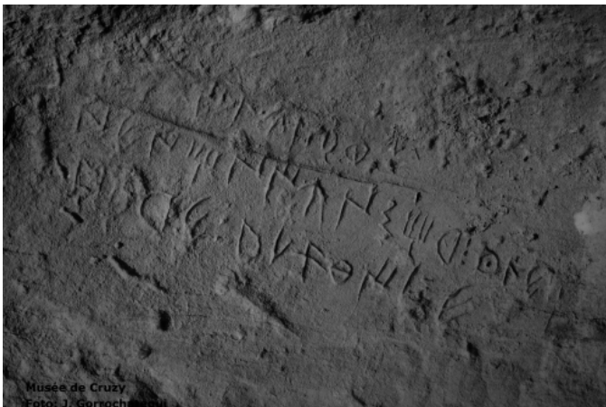
Musée de Cruzy