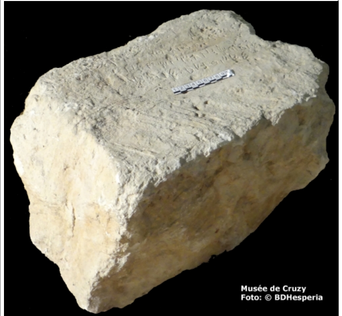
Musée de Cruzy Foto: © BDHesperia

Créditos: Valdeyron - Untermann. Palaeohispanica 2