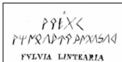
2.4. J. Villanueva (1851, p. 81)