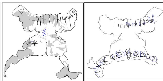
Créditos: Ferrer i Jané 2014