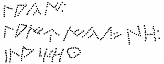
Créditos: Foto y dibujo: Rodríguez y Fernández 2011, 272.