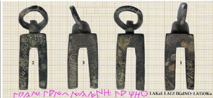
Créditos: Fotos: Rodríguez y Fernández 2011, 272.