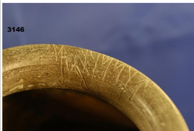
Créditos: Museo de Jaén Foto: Ceres