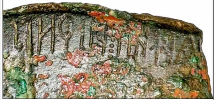
Créditos: "Hesp." Hispania Antiqua. Revista de Historia Antigua, XLIII, p. 11