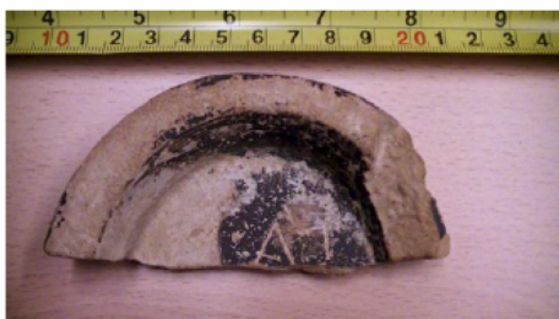
FIGURA 69. Fotografía de la base de cerámica campaniana B amb la ubicació de la inscripció núm. 17.