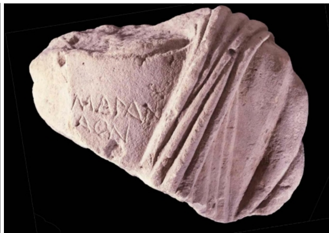
Créditos: MAN Foto: Ceres