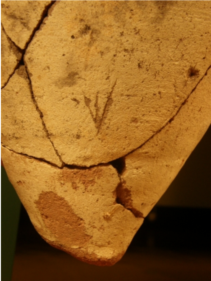
Créditos: Museo de Teruel (Fotografía I. Simón)