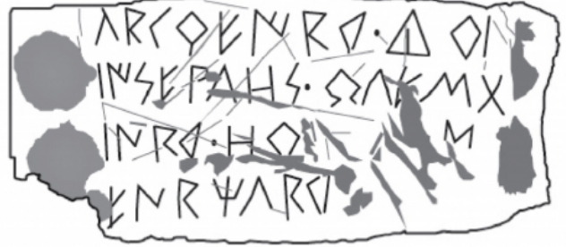
Fig. 6. Drawing of the inscription.