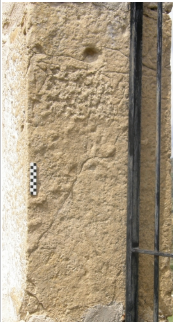
Créditos: Ermita de Nuestra Señora del Cid, Iglesiasuela del Cid (fotografía I. Simón)