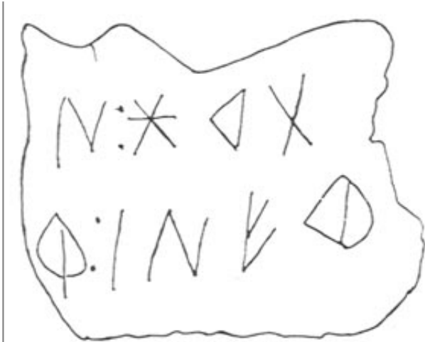
Créditos: Silgo - Fletcher 1987