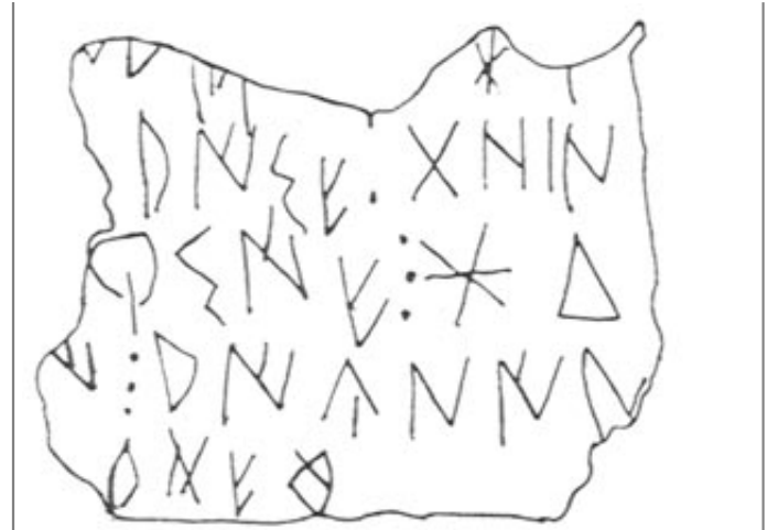
Créditos: Silgo - Fletcher 1987