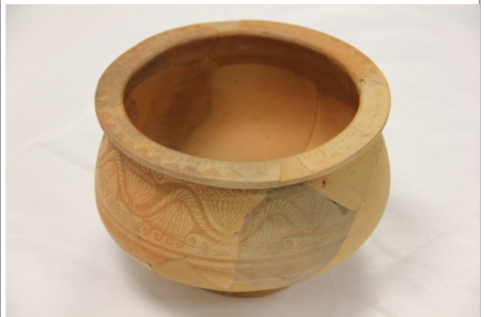
Créditos: Museu de Prehistòria de València_Foto: ALF_junio2014