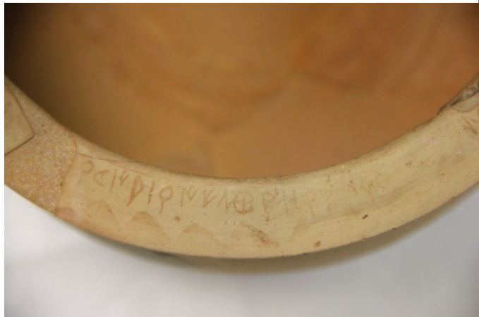
Créditos: Museu de Prehistòria de València. Foto: ALF (junio2014)