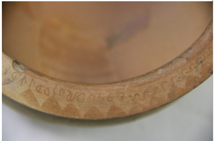
Créditos: Museu de Prehistòria de València. Foto: ALF (junio2014)