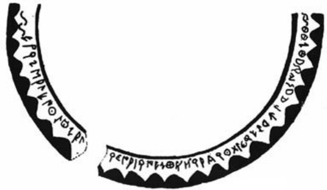
Créditos: Fletcher 1985, fig. 2