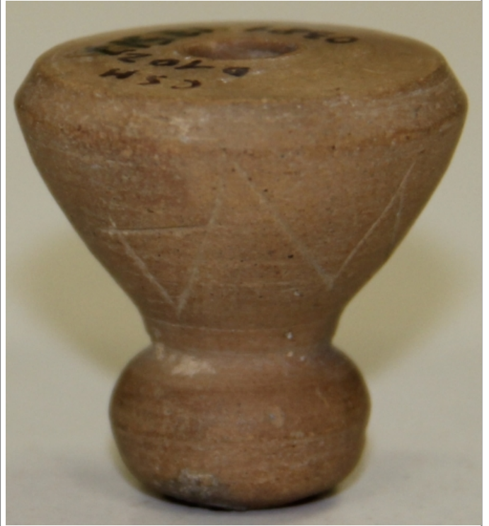
Créditos: Museu de Prehistòrica de València_sept2014_Foto: ALF