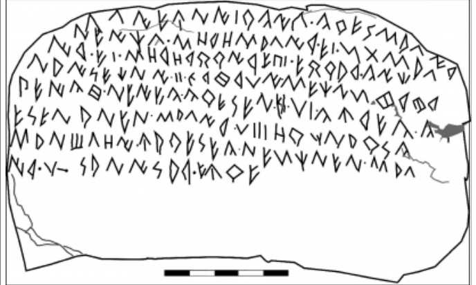
Créditos: Fletcher 1980