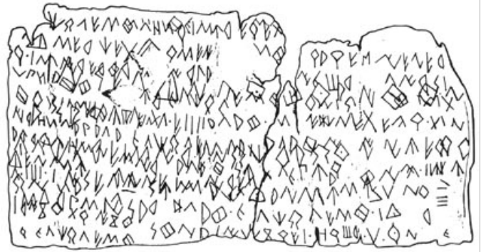
Créditos: Fletcher 1980