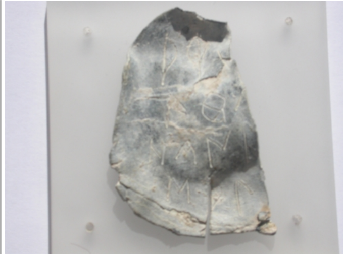
Créditos: J. Velaza